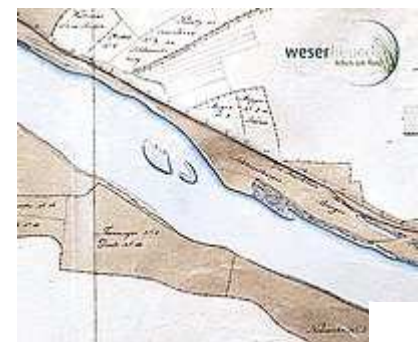
Weserabschnitt bei Schlüsselburg 1829 ...

Für Minden, wo historisch immer ein Bezug der Bevölkerung zur Weser bestand - in der ersten Hälfte des 20. Jahrhunderts gab es mehrere Flussbadeanstalten - trifft das Ergebnis der EMNID-Studie von der allgemeinen Bewusstseinslage der Mindener her in vollem Umfang zu. Seit einiger Zeit wird auch wieder vermehrt in der Weser gebadet.