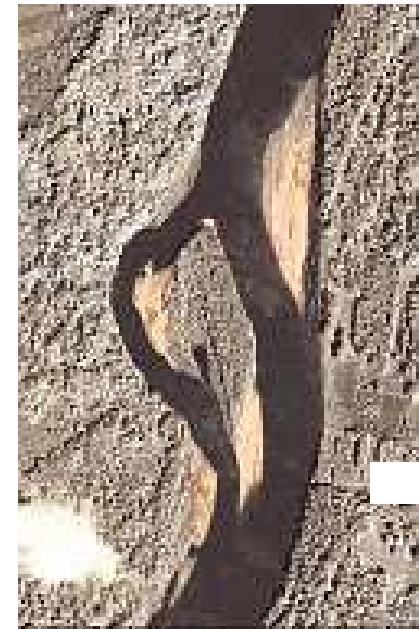
Die Weserfreunde verfolgen das Projekt der Schaffung natürlicher Flussabschnitte - wie hier an der Mulde.

Das Alles würde nicht nur dem Auge des Betrachters und seinen Füßen gut tun, sondern auch den im und am Wasser lebenden Tiere und wachsenden Pflanzen. So sehen die Weserfreunde die schönen Kleider der Weser, eine neue Garderobe, die die Arbeitskleidung der Schifffahrtsstraße ablöst und die Eigenheiten des Flusses zur Geltung bringt (und damit nebenbei die Ziele der Europäischen Union zum guten Gewässerzustand erfüllt). Das alles würde die Weiße Flotte, die für viele im Mindener Land die Nutzung des Freizeitwertes Weser mitverkörpert, nicht behindern. Die Eintauchtiefen der Fahrgastschiffe sind erheblich geringer, als die beladener Frachtschiffe und man könnte die Schiffstypen langfristig dem Fluss anpassen. Rückbau von Weserbuhnen, die für den Frachtverkehr die erforderlichen Wasserstände garantieren sollen, wirken sich für die Weisse Flotte nicht hinderlich aus.