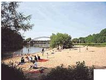
Der Weserstrand Kanzlers Weide.

Minden (mt). Bei Huckleberry Finn heißt es: Das Leben ist leicht, solange man auf einer Flussinsel liegt, Fische grillt, Pfeife raucht und sich Geschichten erzählt. Der Traum Mark Twains macht auch uns Mut für unseren Traum von schöneren Kleidern für unseren Heimatfluss.