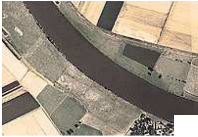
... und heute. | Fotos: Weserfreunde

Was ist nun unter "schöner Weser" zu verstehen? In unserer Region fehlen leider die Kilometer langen Sandufer der Bremer Unterweser, die das Baden attraktiv und den Fluß für die Bevölkerung schön machen. Deshalb sollten sie entstehen, kiesige, sandige Ufer an der Weser, welche zum Baden einladen. Vorstellbar ist das zum Beispiel in Minden der Bereich auf dem Ostufer, entlang von Kanzlers Weide, weil das Flußufer dort keiner anderweitigen Nutzung unterliegt. Für eine Freizeitnutzung muss das Ufer aber zugänglich sein. Zurzeit ist es durch einen undurchdringlichen Hochstaudengürtel aus Brennesseln, Disteln und anderen hartstängeligen Pflanzen vom Wasser abgeschottet.