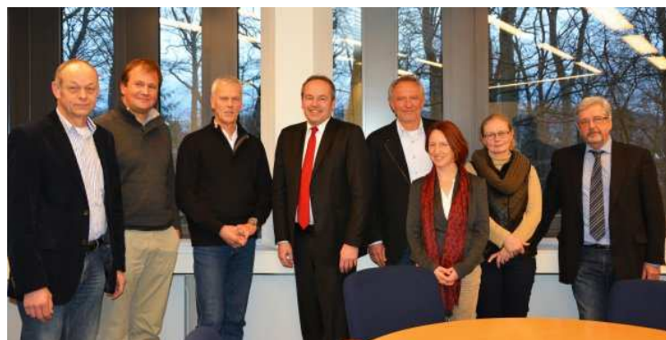
Die weserfreunde besuchten den LKandrat im Kreishaus.

veröffentlicht am 24.03.2015 um 00:01 Uhr