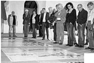
In der alten Saftfabrik Löffler fanden die Weserfreunde eine Unterkunft für ihr Treffen.

Minden (mt/sk). Die Weserfreunde trafen sich kürzlich in den alten Räumen der Saftfabrik Löffler am Brückenkopf. Zahlreiche Themen wie die Gestaltung der kommenden Saison und gastronomische Angebote wurden besprochen.