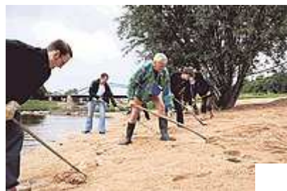
Mit Schaufel und Harke machen die Weserfreunde und Bürger den Strand fit für den Sommer.

Die Gastronomie, die sich die Weserfreunde schon länger wünschen, steckt ebenfalls in der Planungsphase. Ein Interessent habe schon Genehmigungen eingeholt und wolle einen Neubau anlegen. Am Sonntag, 11. Juli, dem internationalen Flussbadetag "Big Jump" wollen die Weserfreunde den Strand mit einem Fest eröffnen. "Genauerer ist vom Fußball abhängig", schmunzelt Spreckelmeyer, da das Datum mit dem Finale der Fußball-WM kollidiert. Ab sofort können die Badegäste den neuen Strand benutzen.