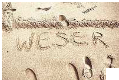
Luca (6) packt für den Weserstrand mit an.

Minden (nas). Sand, soweit das Auge reicht: Mit 300 Kubikmeter frischem Sand füllen die Weserfreunde den Weserstrand auf und erweitern ihn um rund 40 Meter. Einige Helfer und Sponsoren unterstützen den Verein bei den Bauarbeiten.